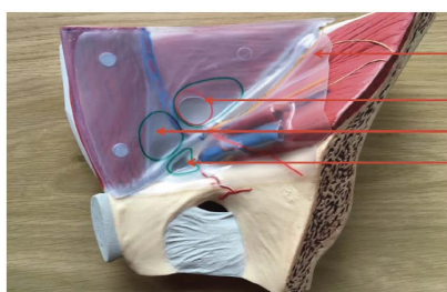
Otrzewna Przepuklina pachwinowa skośna Przepuklina pachwinowa prosta Przepuklina udowa

Siatka dostępna w wersji pre-cut - wstępnie przycięta z otworem na powrózek nasienny, w wersji pre-cut do zabiegów laparoskopowych oraz w wersji anatomicznej.